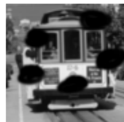
糖尿病視網膜病變